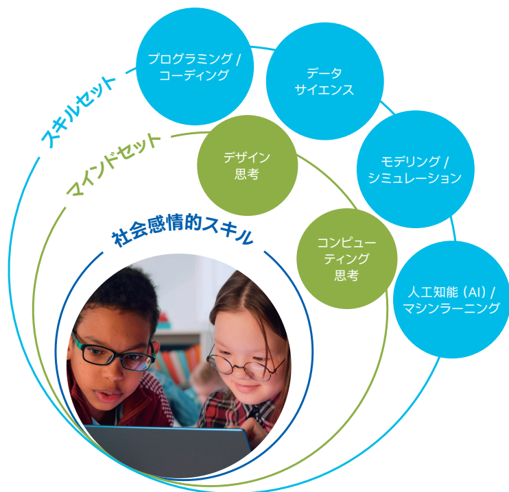
目標とするマインドセットとスキルセット

インテル® Skills for Innovation (インテル® SFI) のフレームワークが描くビジョンは、第4次産業革命の変わりゆく状況に適応するため、必要なスキルを生徒が習得できる環境です。生徒は将来就く職業を考えて準備し、想像して創り出すことで、イノベーターとなる力を身につけることができます。